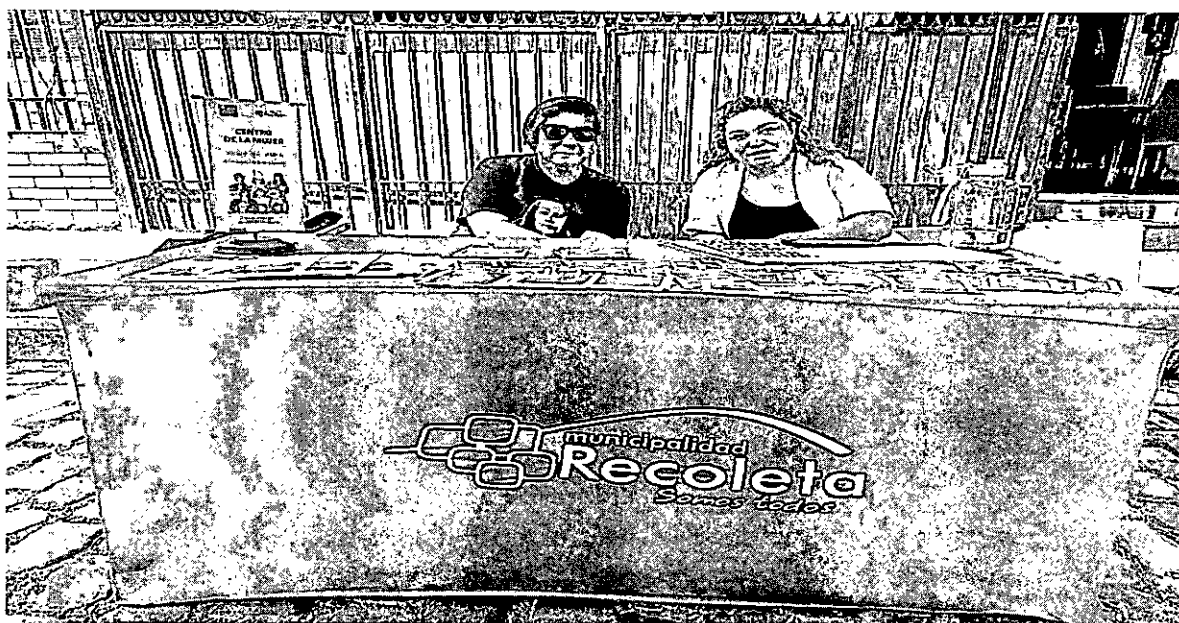
Verificador nº3. Participación en Feria Contra las Violencias